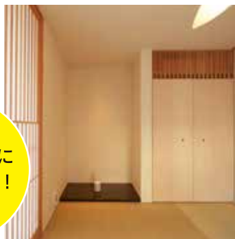
写真は全て以前手がけたお家の写真です。今回の完成見学会のモノではございませんのでご了承ください。